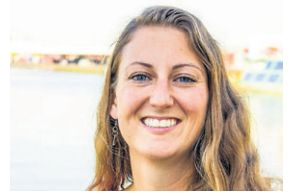
beeld Zero Waste