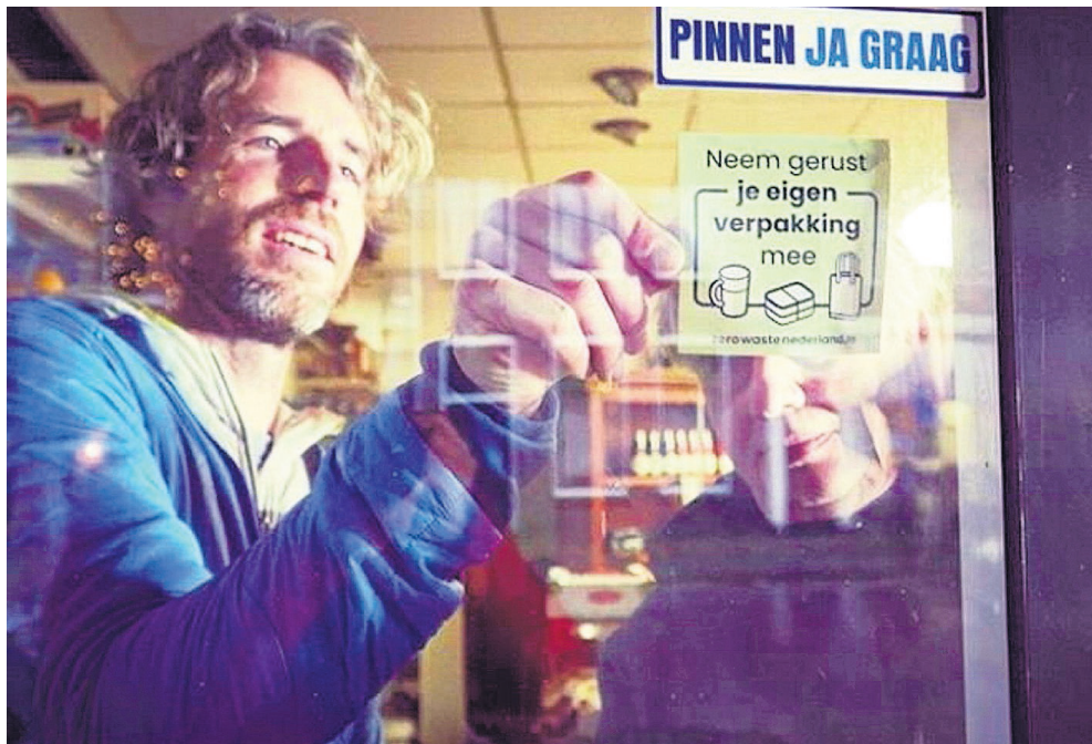
Er zijn veel creatieve manieren om de afvalberg te verminderen.

Kuijlenburg: „Bedenk als consument of je een product echt nodig hebt, en zo ja, of het dan duurzaam kan. Dat laat zien hoe je in het leven wilt staan. Toon me je afval en ik kan zien wie je bent.”