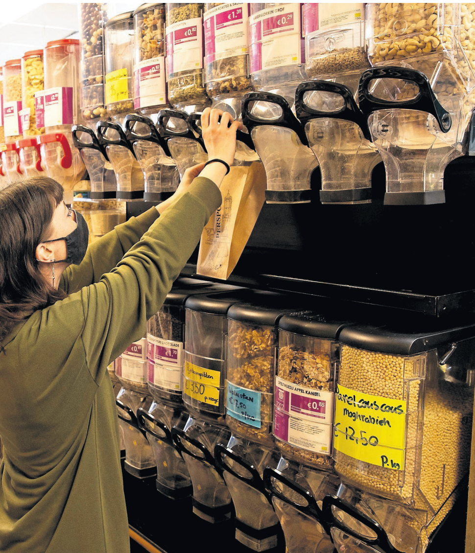
Bij supermarkt Persepolis in Utrecht kun je verse producten opscheppen in je van thuis meegenomen verpakkingsmateriaal.

Voor ongeveer de helft van de klanten is verpakkingsarm winkelen dé reden om naar Persepolis te gaan. De winkel blinkt uit in het aanbieden van zogenaemde bulkgoederen. Rijst, noten en thee zijn onverpakt verkrijgbaar. En dat geldt voor nog veel meer producten, tot olijfolie toe. „Veel mensen nemen bakjes en flesjes van huis mee om de spullen in te doen. Met watervaste stift schrijven wij daarop het gewicht; handig voor de volgende keer.”